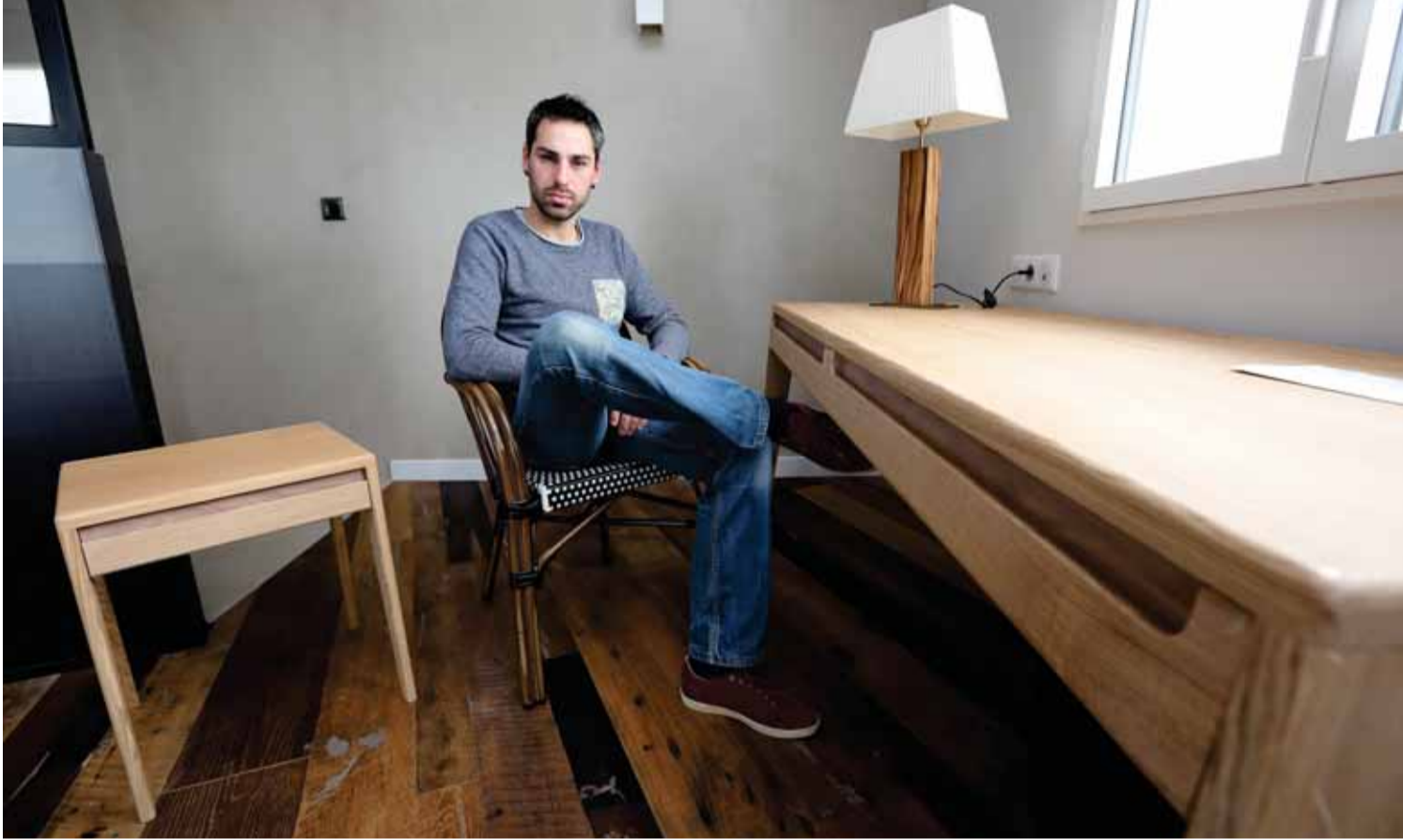
Yoann Pery a dessiné et fabriqué la table basse Iluna et le bureau Eskola. Sa source d'inspiration ? La nature.